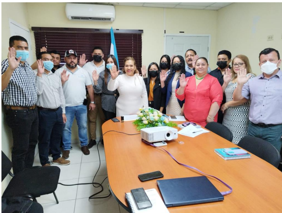
Juramentación del Comité de Control Interno Institucional (COCOIN) 31 de enero de 2023.